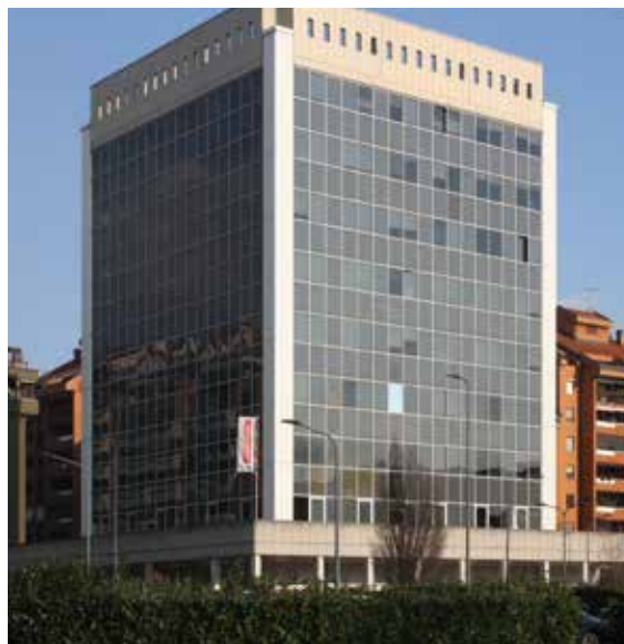
La sede di Faber System a Milano